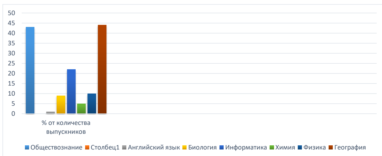
Распределение предметов по выбору